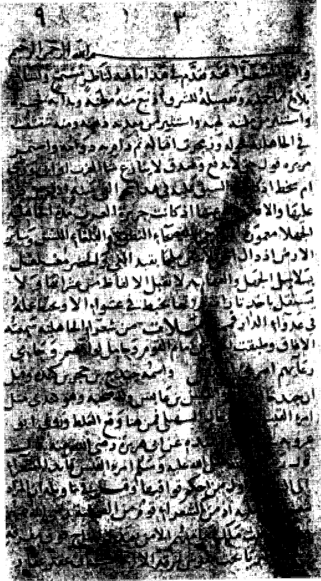
الصفحة الأولى - مخطوطة أحمد الثالث - طوبقو سراي - استانبول رقم ٢٧٩٧